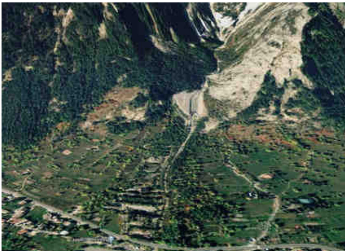
Immagine Google Maps 3D