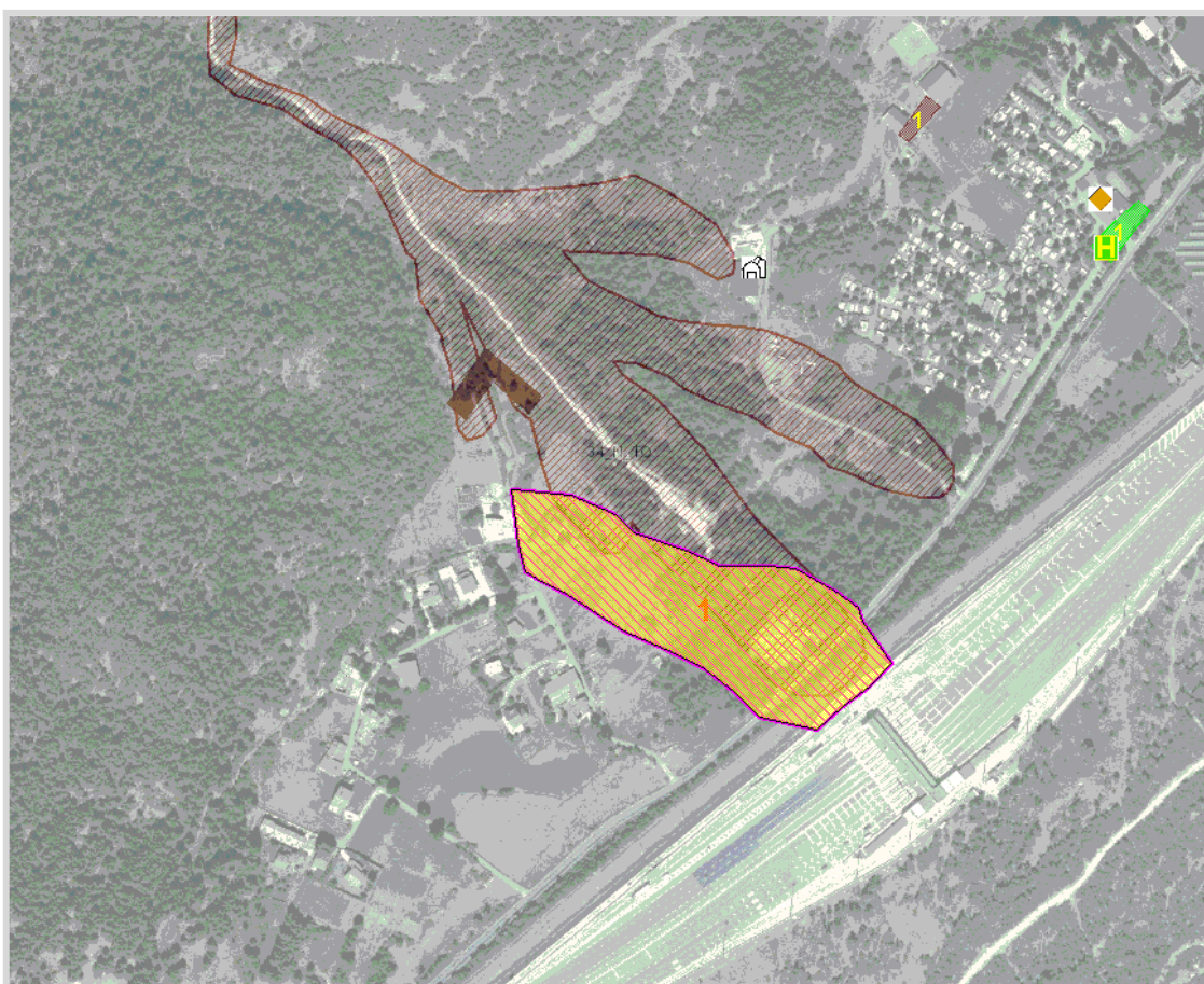
GisMaster-ProtezioneCivile - Estratto della cartografia