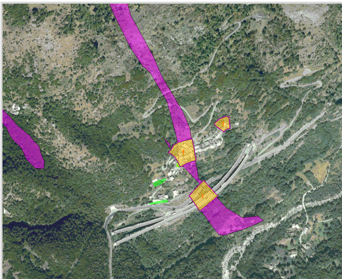
GisMaster-ProtezioneCivile - Estratto della cartografia