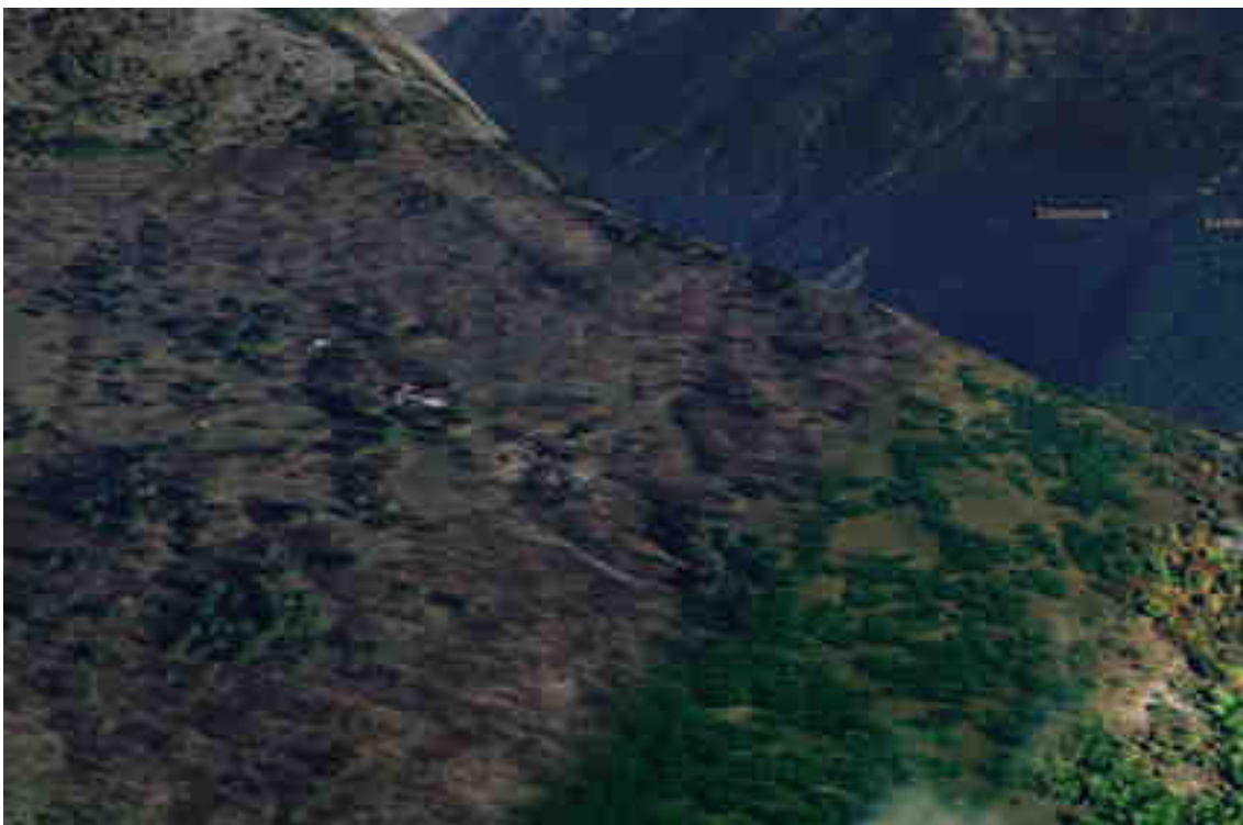
Immagine Google Maps 3D