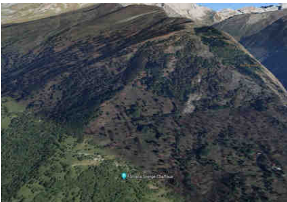
Immagine Google Maps 3D