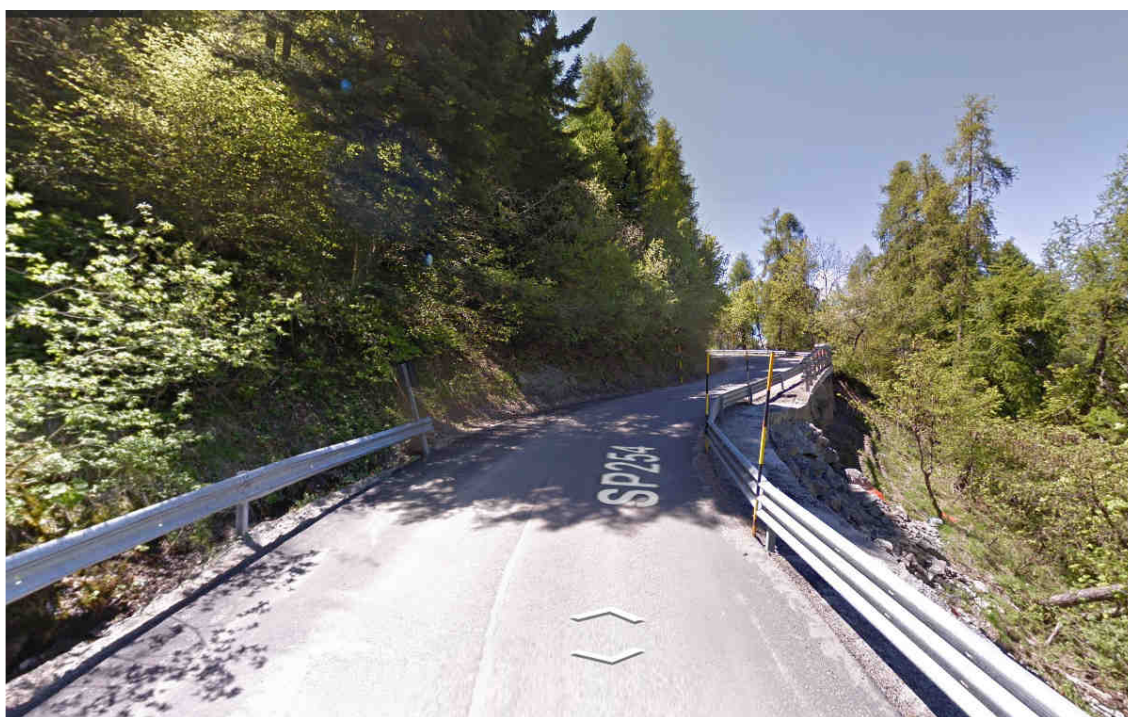
Immagine Google Street View