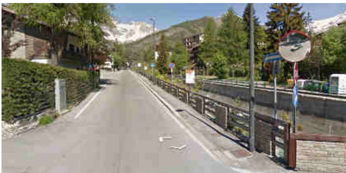
Immagine Google Street View