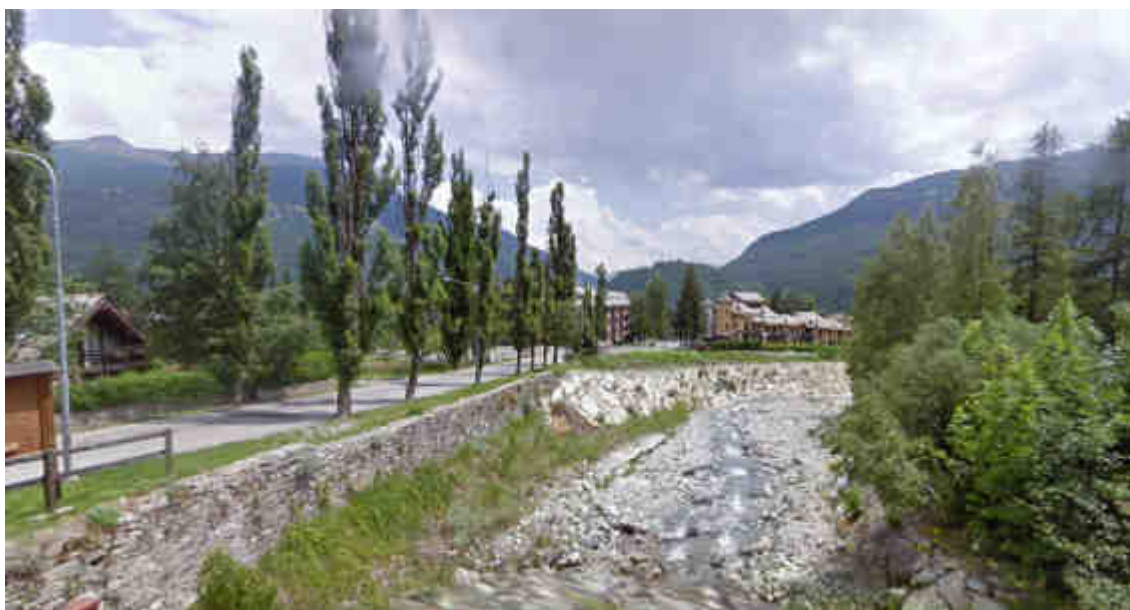
Immagine Google Street View