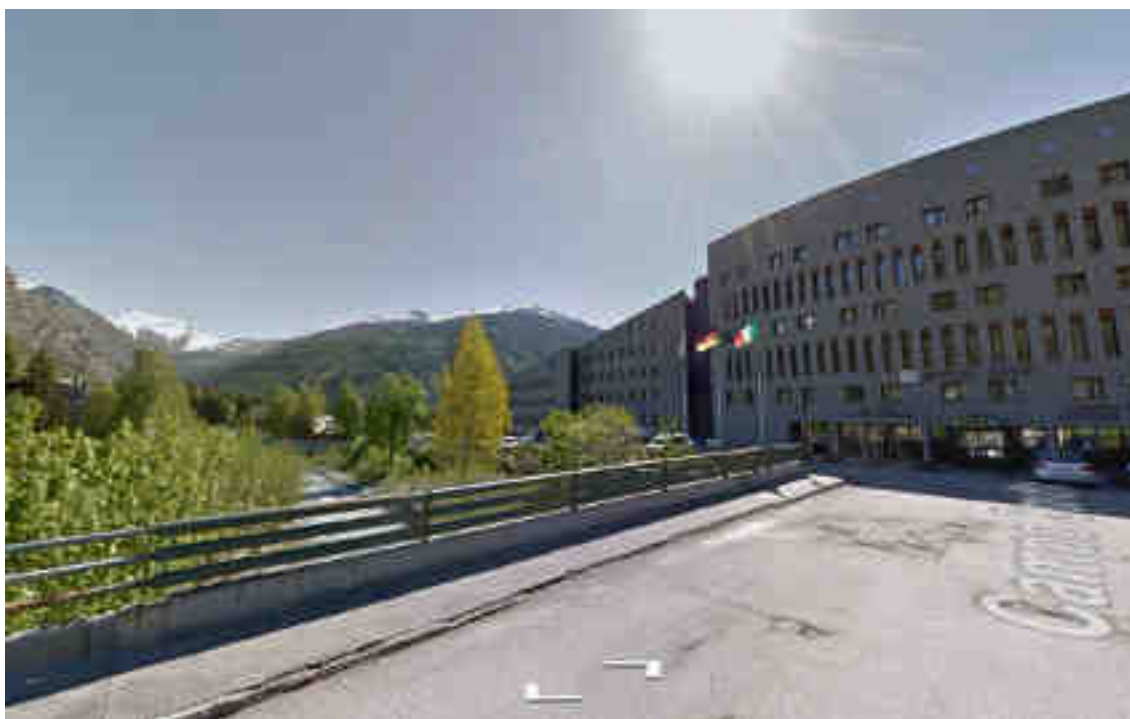
Immagine Google Street View