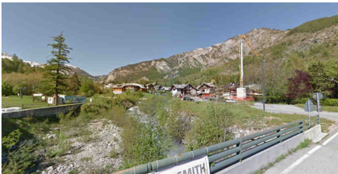
Immagine Google Street View