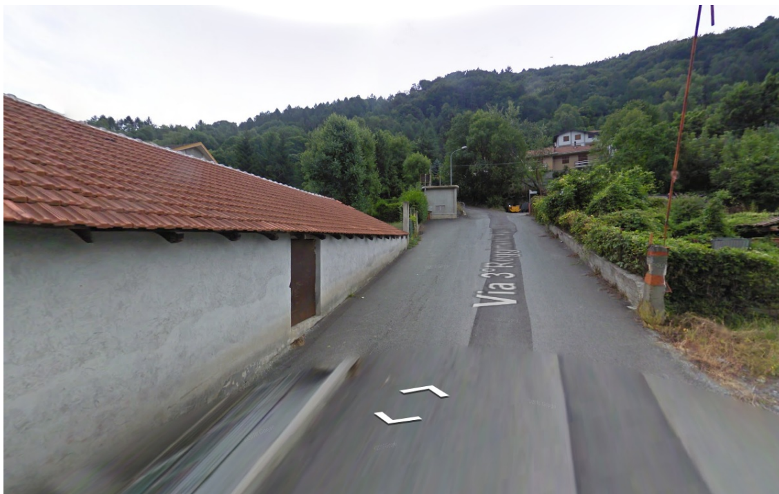
Immagine Google Street View