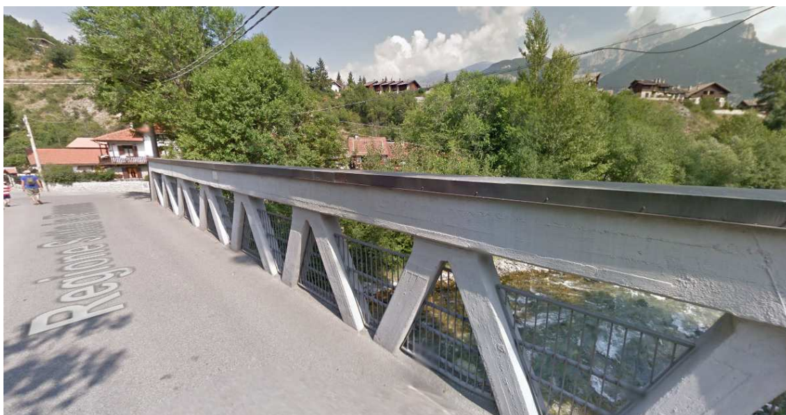
Immagine Google Street View