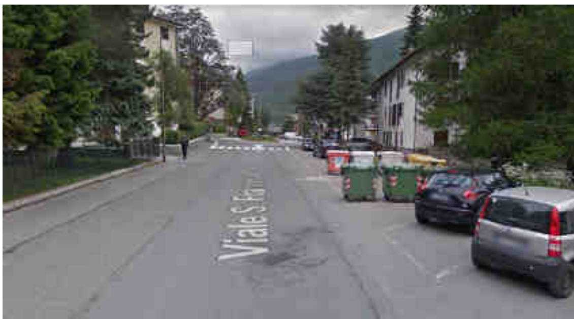
Immagine Google Street View